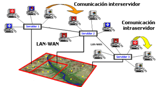
Fig. 1. Modelo comunicaciones básico en un DVE

necesarias costosas comunicaciones inter-servidor para que dos avatares puedan intercambiar información.